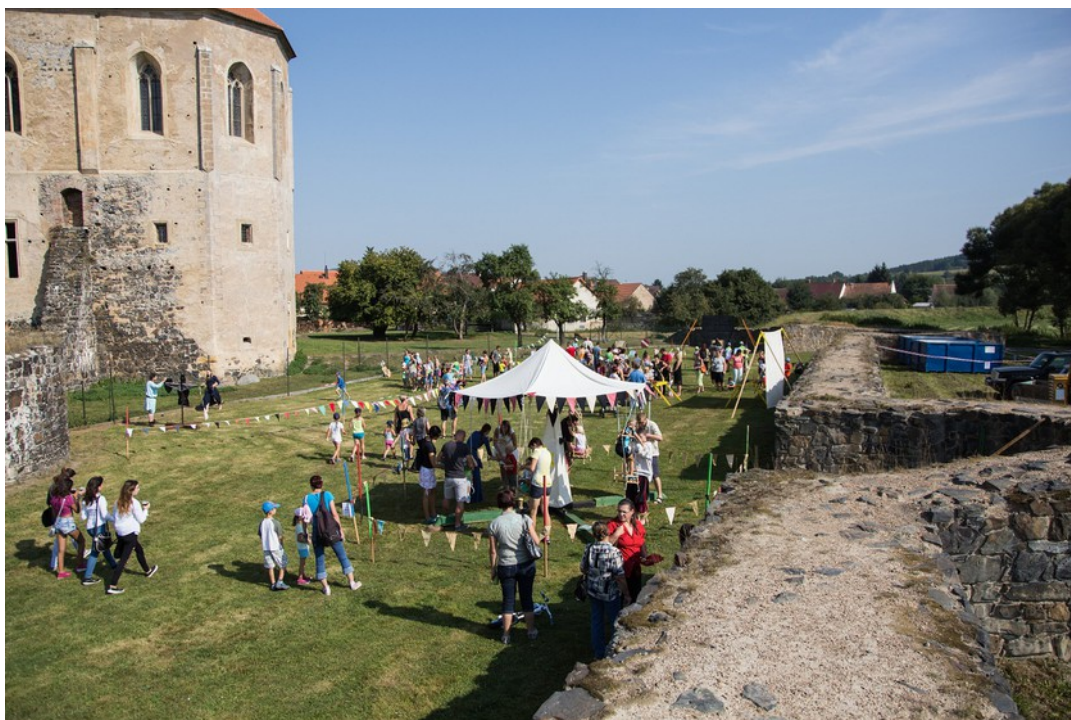
Švihov - Setkání dětských světů - stanoviště za hradem