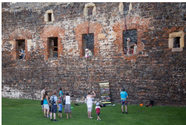
Švihov - Setkání dětských světů - slaňování z hradeb

Malí návštěvníci ať už z řad hendikepovaných, široké veřejnosti či z některého z osmi dětských domovů si před vstupem do areálu hradu vyzvedli náramek do Koráلكové hry a pustili se do středověkého dobrodružství. Mezi úkoly, za jejichž splnění dostávaly děti korálky, nechybělo např. slaňování z hradeb, alchymistická dílna, výuka dobového tance, stezka odvahy nebo proplétání se pavučinou v hradním sklepení. V rámci oživlých prohlídek hradu čekal na děti i detektivní úkol a to najít pána hradu Půtu Švihovského. V jednotlivých místnostech hradu čekaly na děti nápovědy ve formě hraných scének a na konci, pokud správně odpověděly, dostaly indicie. Pokud sesbíraly všechny indicie, podařilo se jim nalézt pana Půtu a získat tak korálek do náramku. Po zdolání všech úkolů, obdržely děti na konci dne diplom a koráلكový náramek na památku. Součástí bohatého programu tvořil též rytířský turnaj, ukázky tradičních řemesel, komentovaná výstava palných zbraní, ochutnávka regionálních potravin či různé tvořivé dílničky pro děti i dospělé. Mezi hlavní body programu pak patřila vystoupení samotných dětí z dětských domovů. Akci zakončil koncert kapely Strašlivá podívaná .