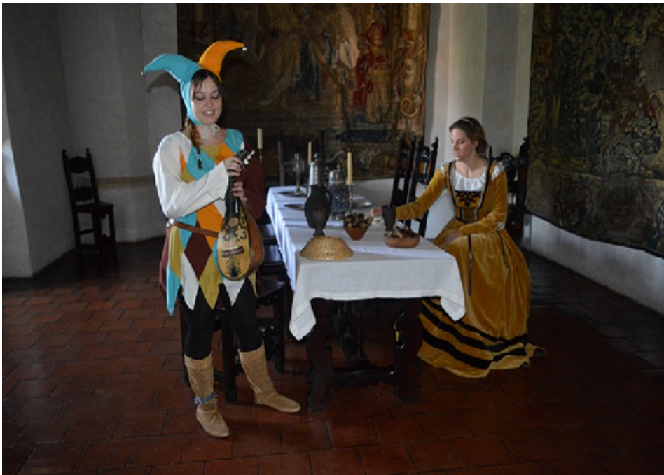
Švihov - Setkání dětských světů - Hodovní síň - oživlé prohlídky hradu