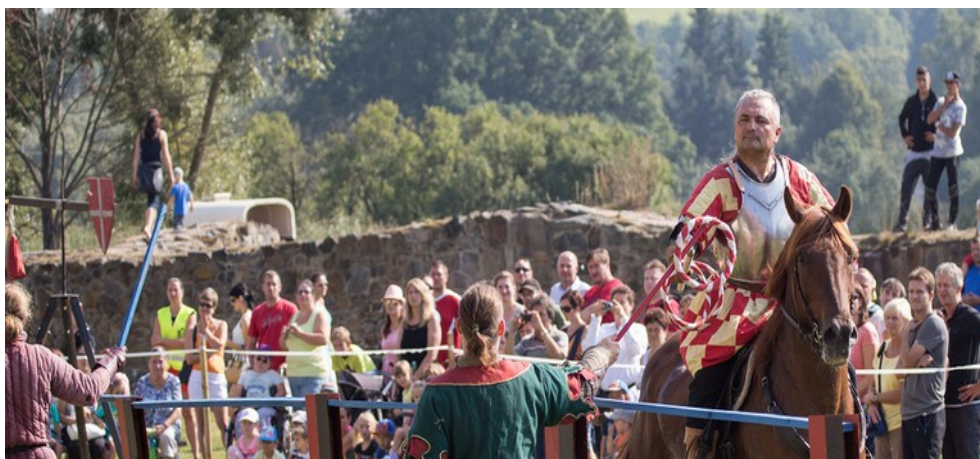
Švihov - Setkání dětských světů - Rytířský turnaj