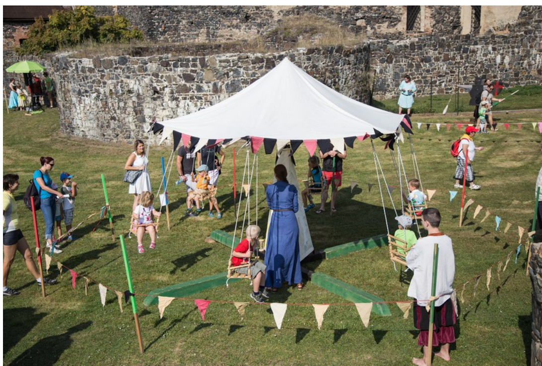
Švihov - Setkání dětských světů - kolotoč pro nejmenší návštěvníky