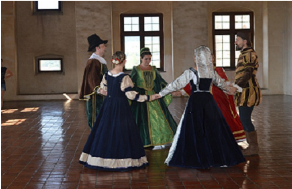
Švihov - Setkání dětských světů - Taneční sál - ukázka dobových tanců