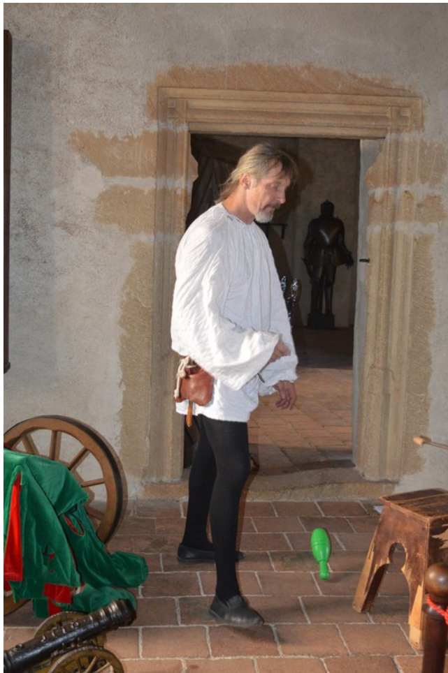
Švihov - Setkání dětských světů - Zbrojnice - oživlé prohlídky hradu