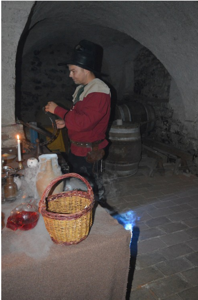
Švihov - Setkání dětských světů - Jižní sklepy - alchymistická dílna