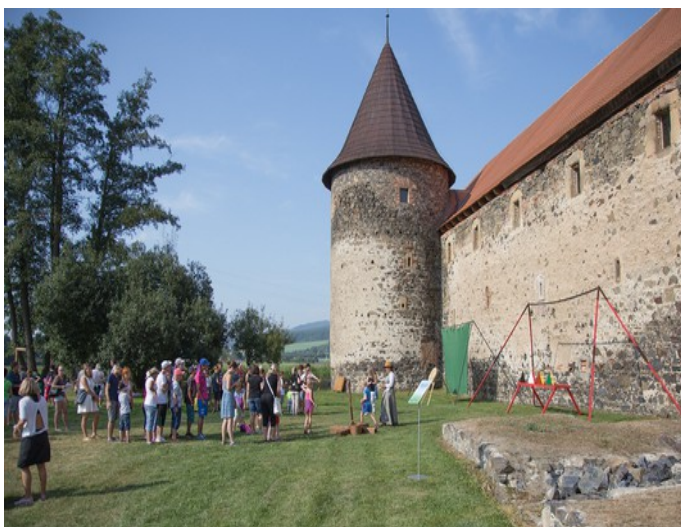
Švihov - Setkání dětských světů - střelba na terč