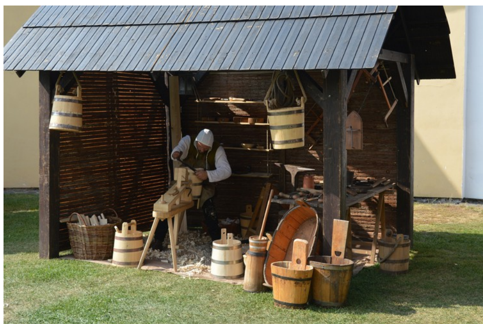
Švihov - Setkání dětských světů - ukázka řemesel