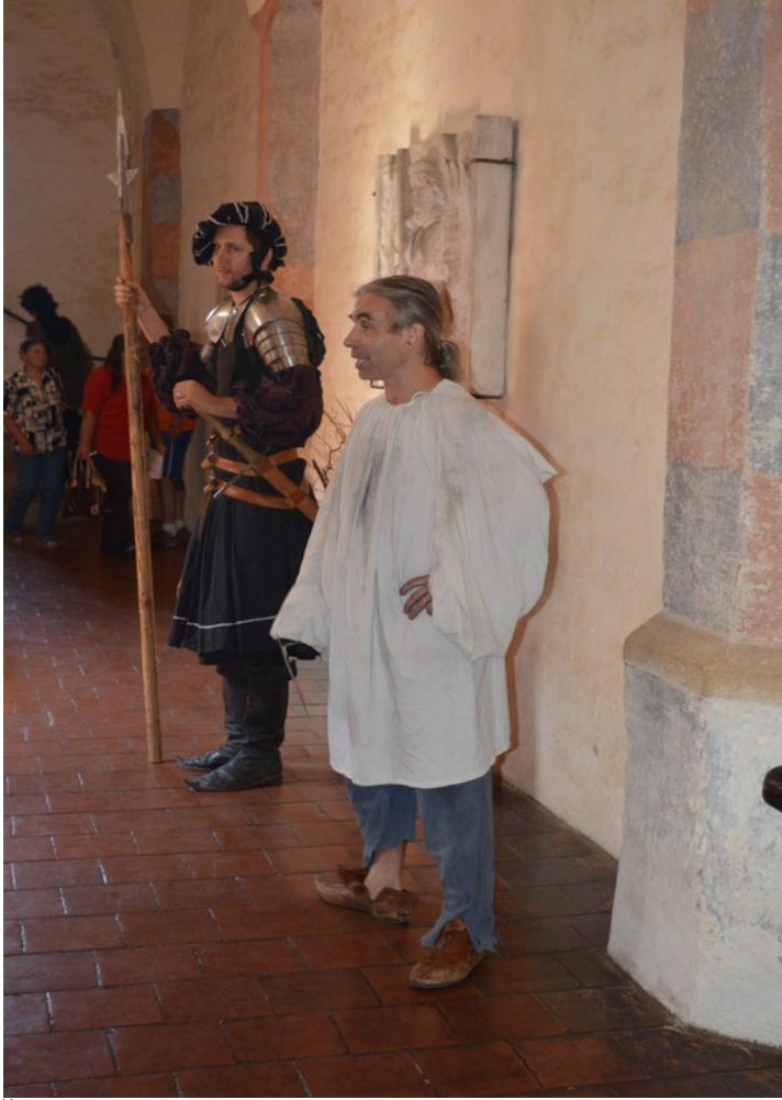
Švihov - Setkání dětských světů - Vstupní síň - oživlé prohlídky hradu